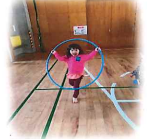
児童センターにてフラフープ列車にチャレンジしました☆