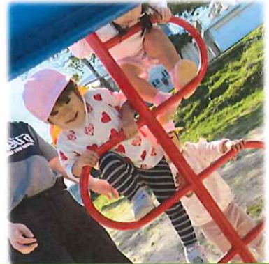
みんなで、お散歩♪ たんぼぼ公園で遊んできたよ♪