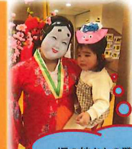
福の神さんの登場にたくさんの幸せをもらいました。