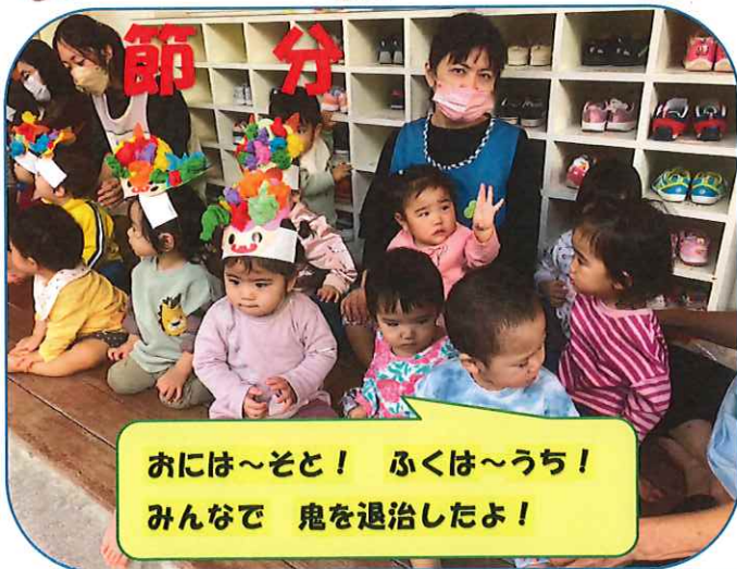
おには～そと！ ふくは～うち！ みんなで 鬼を退治したよ！

入園した頃はまだ歩くこともできなかった子どもたちもたくましく成長し、歩くだけでなくバランスを取りながら登り下りをしたり、幼児食をモリモリ食べられるようになりました。少しずつお話もできるようになりました。日々の保育の中で子ども達と共に笑い、新しい発見をし、私たちに元気なパワーを与えてくれました。保護者の皆様にも様々なご協力を賜り誠にありがとうございます。