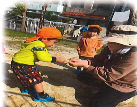
草でおすもう対決をしましたよ～

この一年でとても大きく成長している風組さん。保護者の方と一緒に子ども達の成長を側で見守ることができたこと嬉しく思います。残り少ない風組での生活ですが、進級に向けて楽しく過ごしていきたいと思えます。一年間、たくさんのご理解とご協力ありがとうございます。