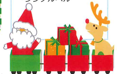
ちぎり貼りでは、線からはみ出ないように 折り紙の形を見てうまく貼ってます!!

今月の歌 ・あわてんぼうのサンタクロース ・真っ赤なお花のトナカイ 今月のダンス ・ジングルベル