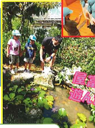
屋富祖公民館で 遊んだよ!