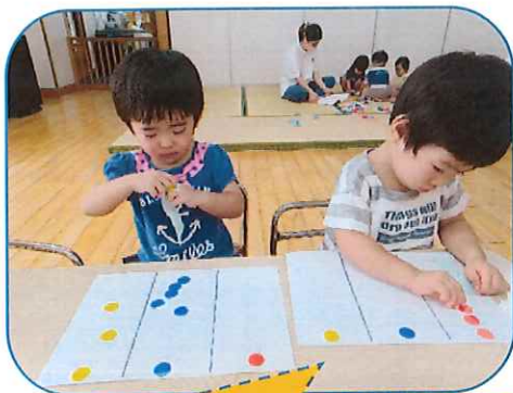
「赤」「青」「黄色」を知らせながらシール貼りに挑戦しました