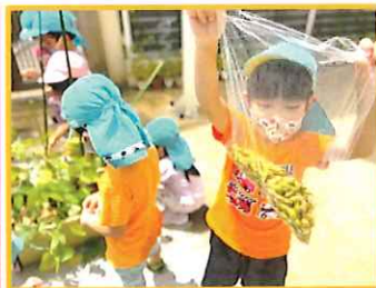
えだまめ 収穫しました!