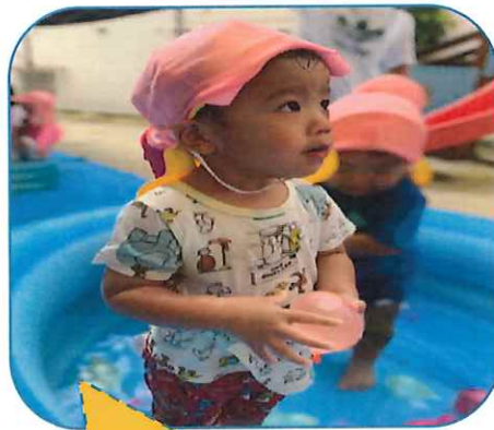
水の感触を楽しんでいます!(^^)!