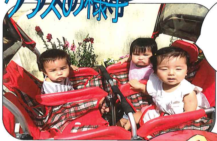
初めて散歩車に乗って園庭をお散歩～♪ 良い気持ち