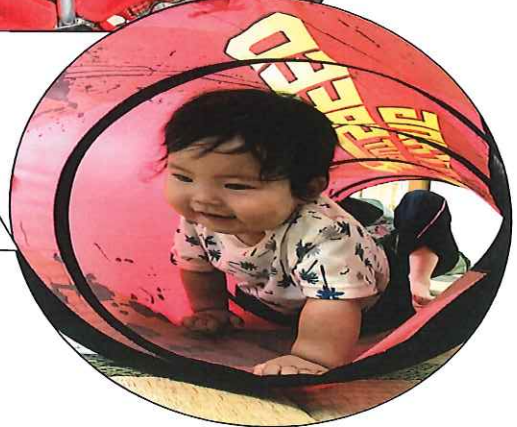
トンネルくぐり楽しいなあ～♥もうすぐ先生のもとにゴール!!!!