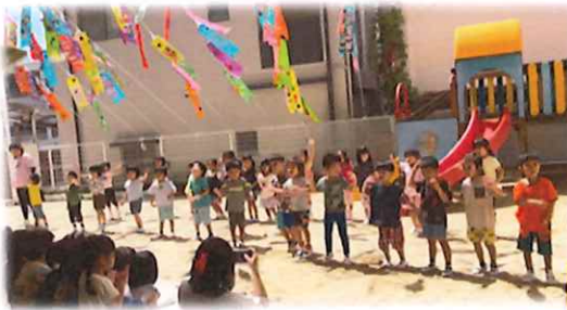
こいのぼり掲揚式では、太陽組さんもダンスの出し物をしました！