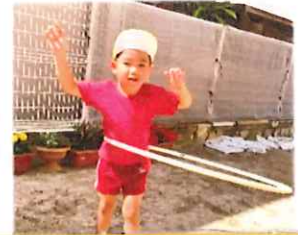
フラフーズを練習中です！